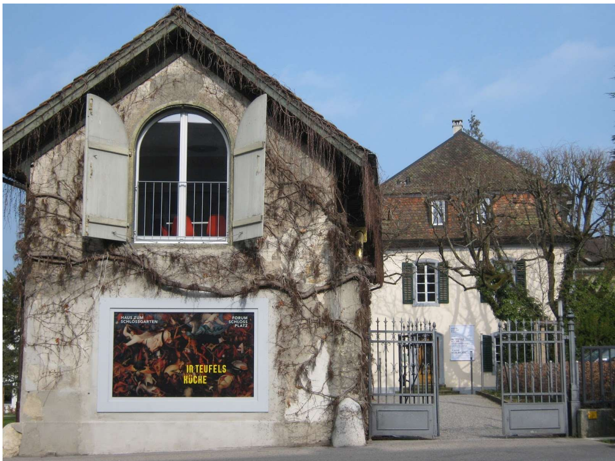
Eingang zum Schlossgarten